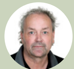
Kennt Hoffman Bovärd