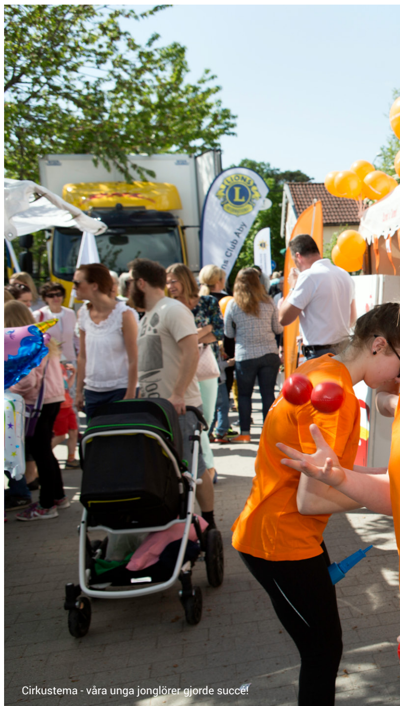
Cirkustema - våra unga jonglörer gjorde succé!

– Vi har öppettider på områdeskontoret och alla är välkomna dit för att prata med oss. Dessutom har vi våra bovärdar som är ute mycket i området som lyssnar in och kommunicerar med hyresgästerna. Men att träffas och ha kul tillsammans är ett bra sätt att stärka kontakten mellan oss