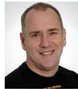
PER EDMAN Bovärd, Ektorp, Kneippen och Gamla Lasarettet